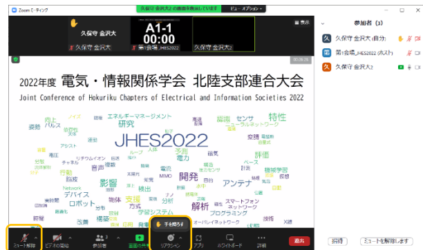
「ミュート」、「手を降ろす」