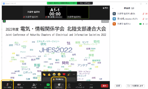
「手を挙げる」、「ミュート解除」